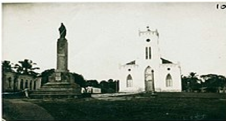
Imagem 02: Catedral de Santa Teresa em Tefé-Am anos 60