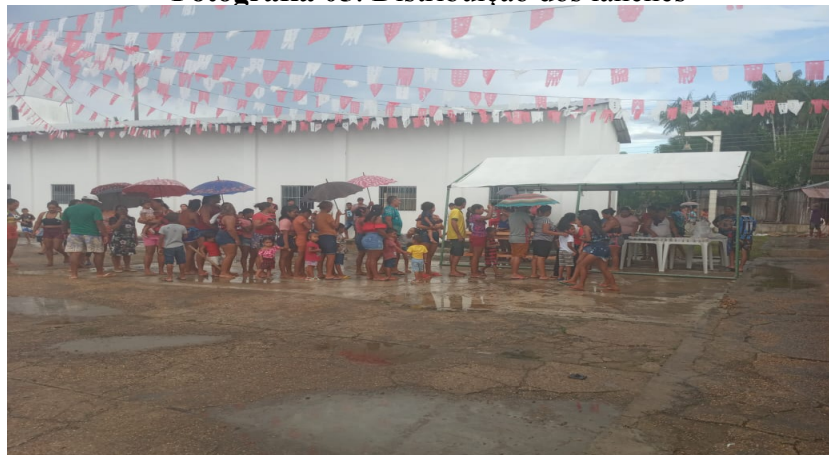
Fotografia 05: Distribuição dos lanches

Também é uma tradição no primeiro dia do festejo a distribuição do lanche de bolachas com sucos para todos que forem prestigiar o levantamento do mastro, todos os anos ocorre esse lanche para que os fiéis e os moradores possam comemorar o início da festividade.