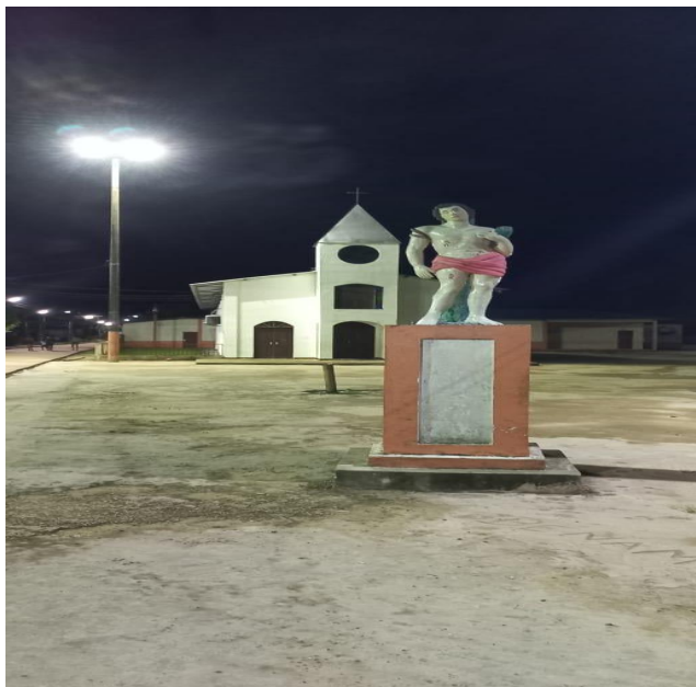
Fotografia 02: Frente da igreja e do santo são Sebastião,