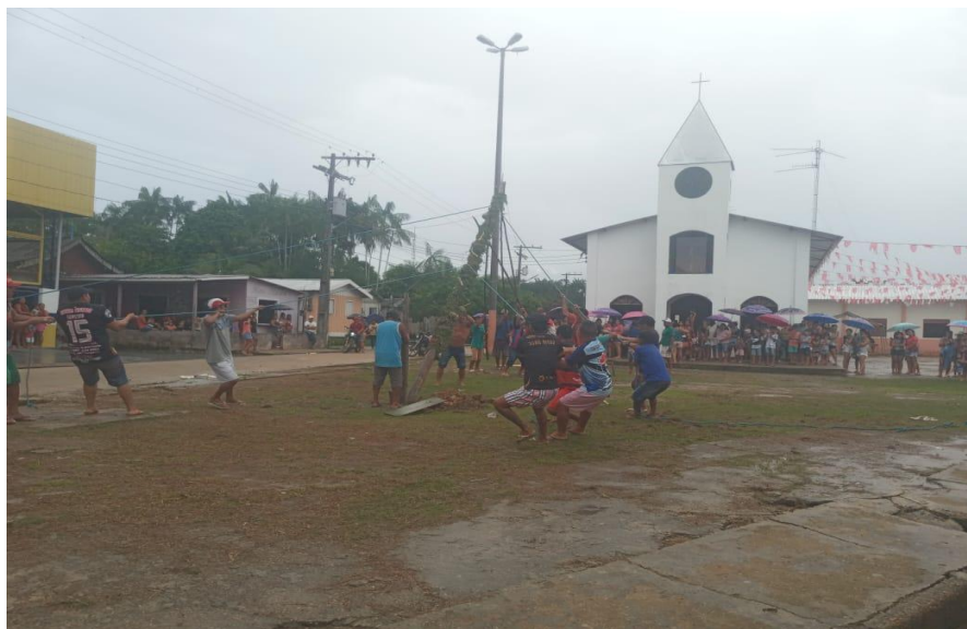
Fotografia 06: Levantação do Mastro

O mastro é composto por cipós, frutas, como bananas e coco e contém dinheiro também, geralmente 50 ou 100 reais. No topo do mastro a bandeira com a imagem do santo é colocada, a foguetada sinaliza o início do festejo, neste momento várias pessoas se reúnem para presenciar o levantamento do mastro. Logo quando sinaliza o início do festejo várias pessoas de comunidades distintas, pegam suas canoas ou barcos e encostam no porto que é tomado de muitas embarcações que trazem devotos de vários lugares da região, além é claro de atrair para a festa.