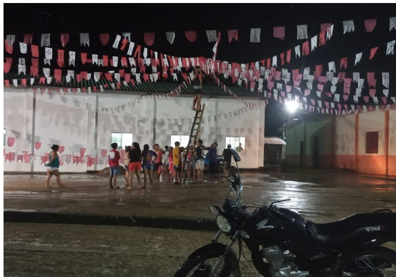
Fotografia 04: Organização das bandeirolas

movimentação dos fies organizando os espaços e enfeitando a praça com bandeiras representando o tempo festivo. As bandeiras coloridas são amarradas nas cordas que saem do centro e direcionados para os espaços que delimitam onde será o arraial. Neste momento de organização não apenas os responsáveis como os moradores se juntam para deixar pronta a estrutura, para que o festejo seja iniciado conforme as expectativas.