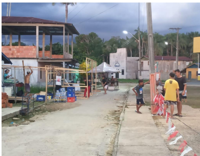
Fotografia 03: Montagem das barracas ao redor da praça

O festejo de São Sebastião inicia-se no dia 10 e finaliza no dia de 20 de janeiro, antes mesmo de iniciar várias pessoas se concentram ao redor da praça montando suas barracas para vendas de bebidas e comidas, também são montadas barracas de brincadeiras como de tiros ao alvo. O comércio neste tempo festivo fica bastante agitado, da mesma forma como o distrito através da movimentação das pessoas neste local, muitas pessoas chegam procurando abrigo por serem de outras comunidades ou de outras cidades. Muitos visitantes recebem acolhimento em casa de conhecidos ou até mesmo de desconhecidos