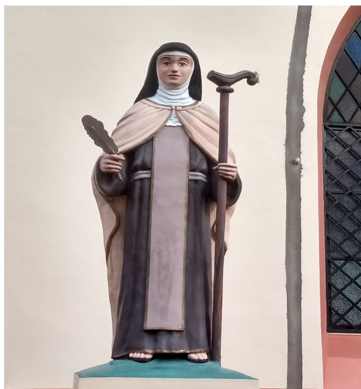
Fotografia 01: Imagem da santa Teresa na matriz.

é dedicado para as demonstrações de fé e são dedicadas para os rituais da igreja como orações, devoções e celebrações. A matriz além de ser um espaço religioso é também um espaço cultural, pois é utilizada para vários eventos e bastante reconhecida, tornando-se um patrimônio da cidade de Tefé. Percebemos que a fé não está relacionada apenas na santa, acredita-se que, além disso, é preciso demonstrar dedicação ao lugar sagrado, pois seria uma forma de devoção. Consideramos que a fé é um elemento constitutivo das relações socioreligiosas estabelecidas no cotidiano. (CORRÊA, 2019).