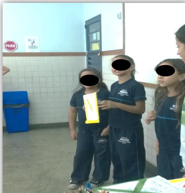
Figura 7 - Apresentação de placas

A partir desta elaboração observaram-se a criticidade, pois os educandos na maioria das placas elaboradas abordaram questões como imprudências no trânsito e acidentes que podem ser evitados com conscientização (Figuras 7).