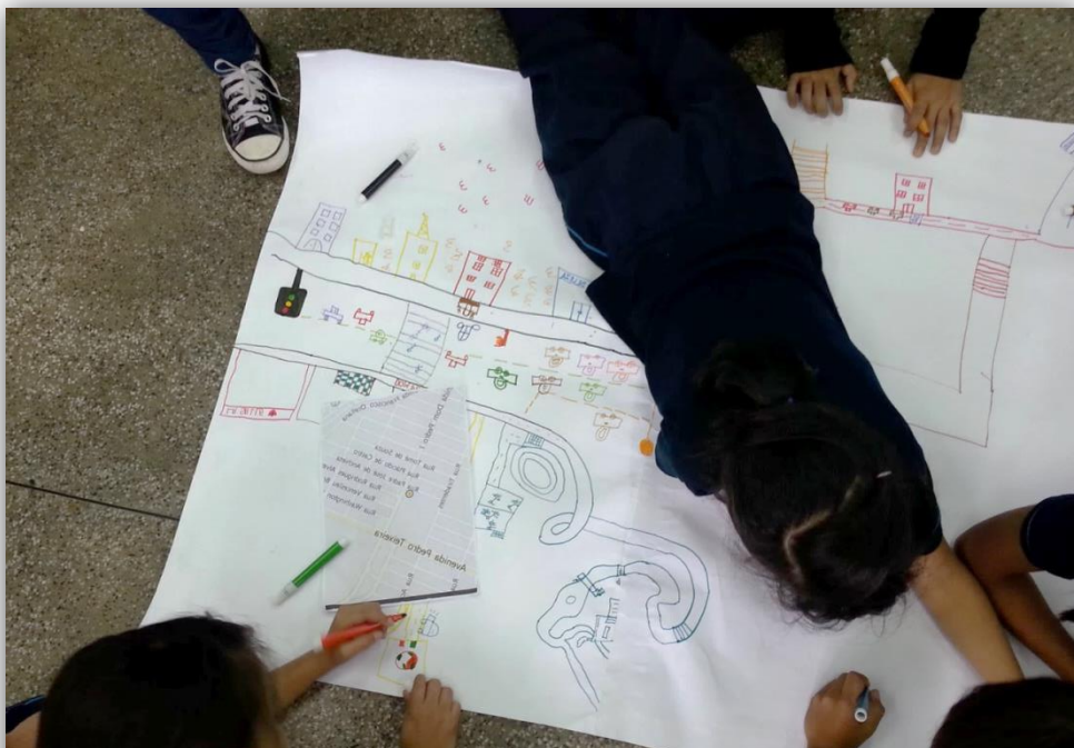
Figura 4 - Atividade de localização da escola.

Houve também por meio da explanação sobre a localização do bairro em que a escola está situada, a possibilidade de trabalhar aspectos da disciplina de Geografia, como a questão de espaço. Questões culturais e turísticas também foram destacadas pelos educandos, pois pontos turísticos da cidade foram ressaltados por alunos, exemplo: Teatro Amazonas e arena da Amazônia. Após o diálogo, ocorreu a elaboração do trabalho em equipe (Figura 4). Neste momento, constatamos que os alunos têm visão distorcida quanto à localidade da escola, muitos alunos não conhecem as ruas além das que moram. Por isso a importância da fala da criança.