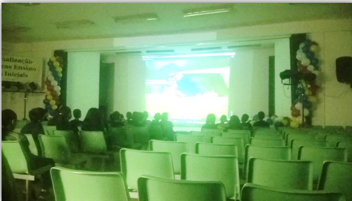
Figura 1 – Apresentação de vídeo: Educação no trânsito.

A intervenção interdisciplinar na sala de aula ocorreu em dois dias na escola e as atividades elaboradas ocorreram em uma turma de 3º ano, que estava sendo acompanhada por meio da observação direta. O tema abordado durante as apresentações foram algumas regras de trânsito, a escolha deste tema é oriunda de uma necessidade observada no decorrer das visitas in loco , pois se avistou que algumas crianças não têm acompanhamento de pais ou responsáveis no deslocamento para instituição e com isso as tornam vulneráveis a imprudência do trânsito.