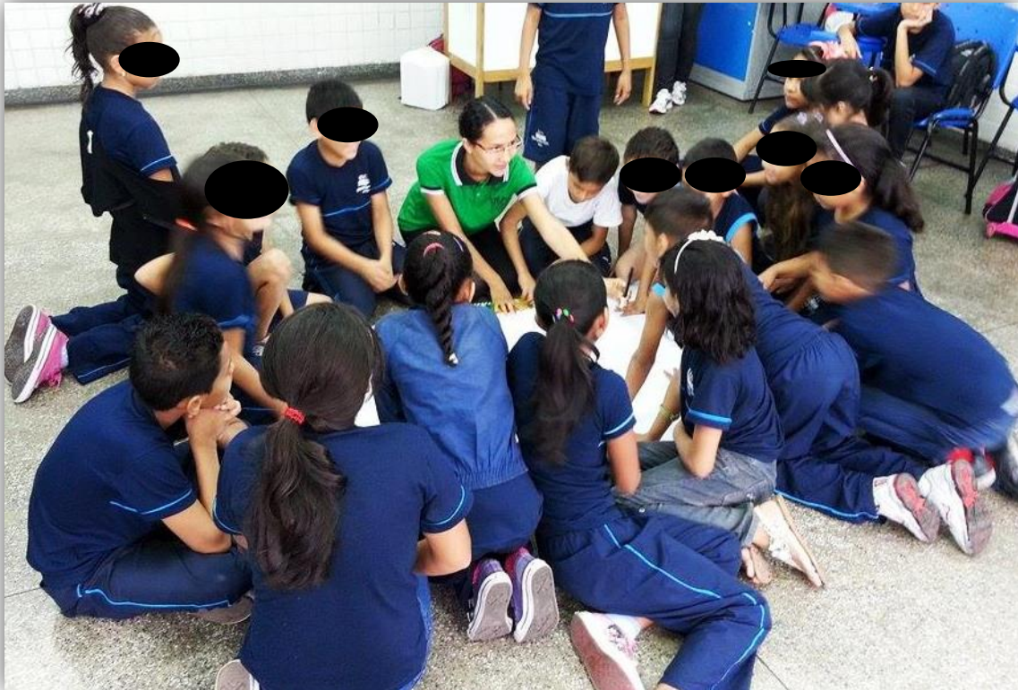
Figura 2 - Aula interdisciplinar

Em seguida solicitou-se a produção em equipe de um mapa de GPS da localização da escola. As crianças participaram e interagiram durante toda a produção (Figura 2).