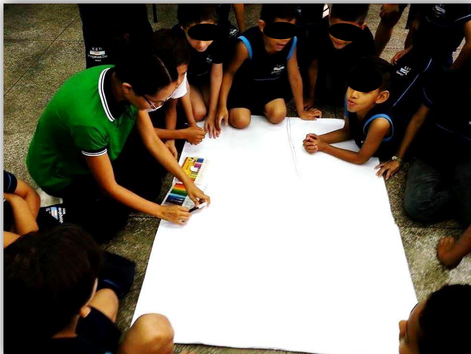
Figura 5 - Atividade em equipe

O professor teve que interferir no trabalho em equipe, pois os alunos evidenciaram dificuldade no trabalho em conjunto, não estavam conseguindo dividir tarefas e com isso apenas dois ou três faziam a atividade, por isso o professor teve que mediar atribuindo tarefas a cada participante da equipe (Figura 5).