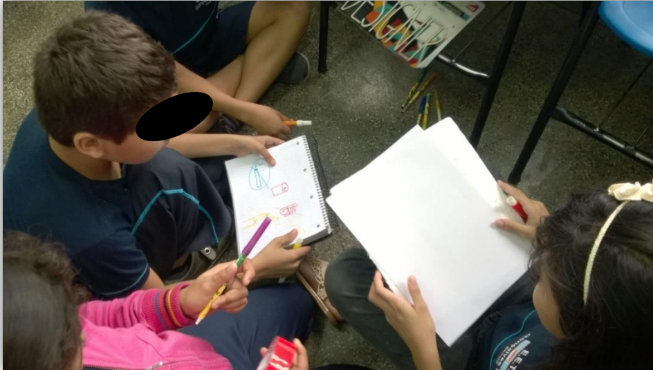
Figura 6 - Elaboração de placas de trânsito

A partir desta elaboração observaram-se a criticidade, pois os educandos na maioria das placas elaboradas abordaram questões como imprudências no trânsito e acidentes que podem ser evitados com conscientização (Figuras 7).