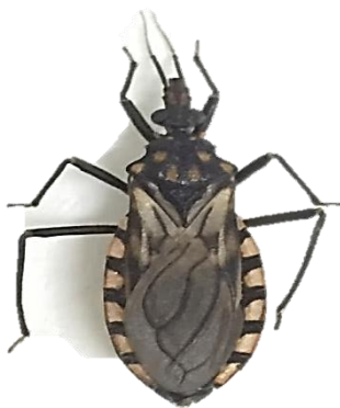
FIGURA 2- Imagem de um exemplar adulto de Triatoma maculata (Erickson, 1848)