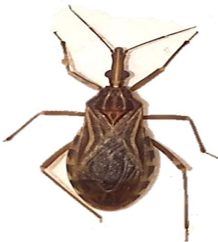
FIGURA 1- Imagem de um exemplar adulto de Rhodnius prolixus Stal, 1859

maculata é o vetor doméstico mais importante. No Brasil, T. maculata foi encontrado em galinheiros em áreas peridomésticas e esporadicamente em residências no estado de Roraima, na Amazônia brasileira. Assim, esta espécie é um vetor potencial para T. cruzi (LUITGARDS-MOURA, et al. , 2005)