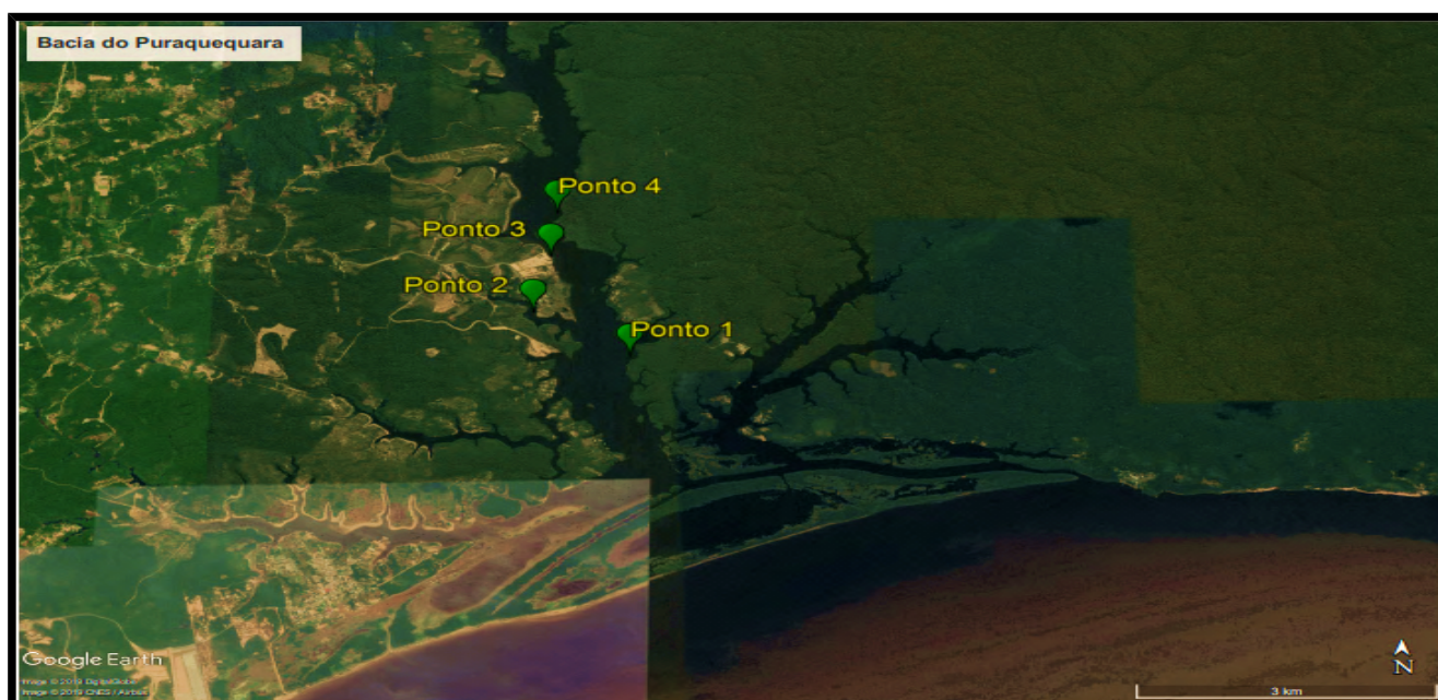
Figura 2 - Distribuição dos quatro pontos de aplicação do PAR ao longo da bacia do rio Puraquequara