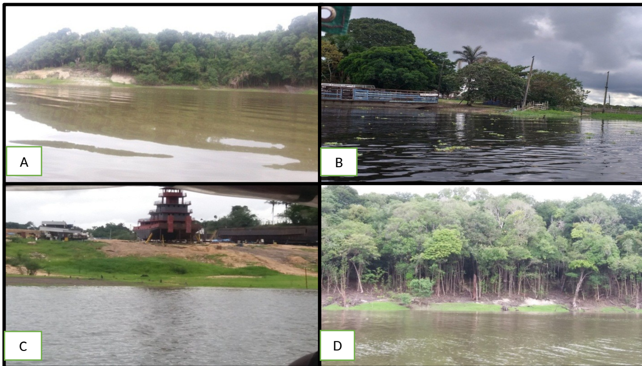
Figura 3 - A) Ponto 1 com baixa influência antrópica; B) Ponto 2 abatedouro bovino; C) Ponto 3 estaleiro naval; D) Ponto 4 com baixa influência antrópica.