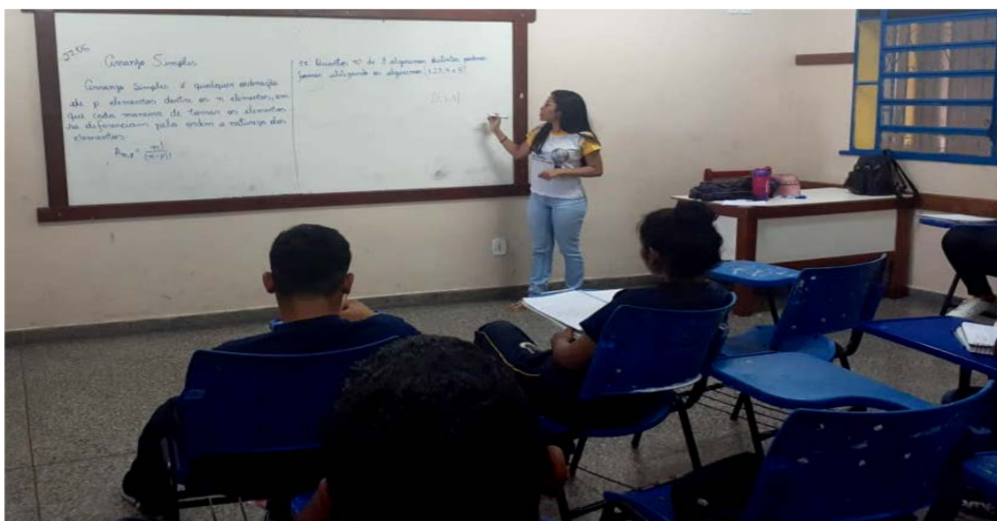
Figura 02: Aula sobre arranjo

Passo a passo da aula: Primeiramente foi mostrado um exemplo de permutação para que notassem a diferença quando fosse abordado o Arranjo. Após notarem a diferença, o conceito de arranjo foi definido a fim de fixarem e compreenderem ainda mais o assunto. Finalizando a aula com exercícios de fixação. (Apêndice E1)