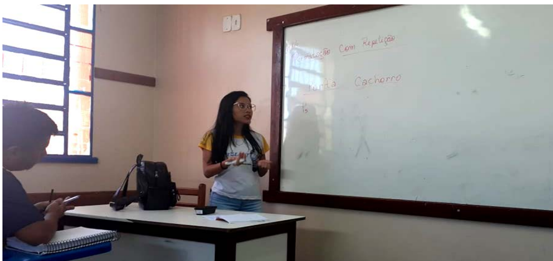
Figura 01: Aula sobre permutação

Passo a passo da aula: Foi revisado o conteúdo de permutação simples, dado anteriormente, como exemplo e mostrado a diferença entre permutação simples e permutação com repetição, o que foi logo percebido pelos alunos. Logo em seguida os alunos já conseguiam resolver os exercícios. (Apêndice D1)