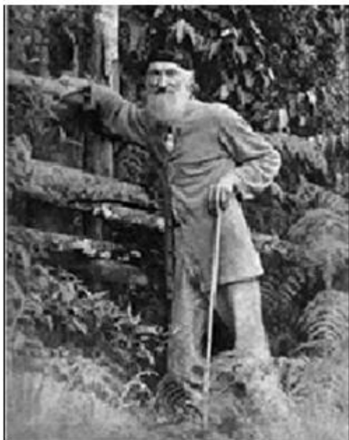
Figura 2: Fritz Müller ~ 1891.