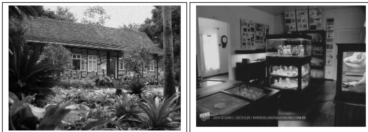
Figura 1: Vista externa do MEFM e de uma de suas salas.

Blumenau é uma cidade situada no estado de Santa Catarina/BR e teve alemães como colonizadores. Entre eles Johann Friedrich Theodor Müller, mais conhecido como Fritz Müller. O Museu, que leva o seu nome, é uma das casas em que morou o naturalista no Brasil (figura 1).