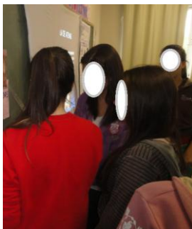
Figura 3: Apresentação das sínteses produzidas sobre a Desmistificação de crenças acerca do arco-íris.