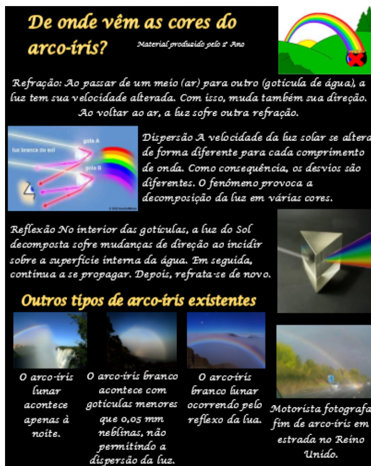
Figura 4: Material informativo elaborado pelos estudantes acerca do tema arco-íris.