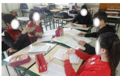
Figura 2: Elaboração das sínteses, a partir de leituras e do apoio do professor de Física.

A atividade central para o desenvolvimento da unidade consistiu no estudo de quatro temas distintos 4 , a partir da organização das equipes de trabalho. Cada equipe recebeu um tema para o desenvolvimento e, a partir de diferentes materiais de apoio (livros, artigos científicos, vídeos, fotos), os estudantes organizaram apresentações (figura 2), apresentados e discutidos, posteriormente, para que os conhecimentos pudessem ser socializados, na forma de seminário. Nesta fase, o professor atendia às equipes e as orientava na organização das atividades.