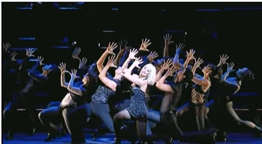
Figura 6. Cena de Chicago, o Musical