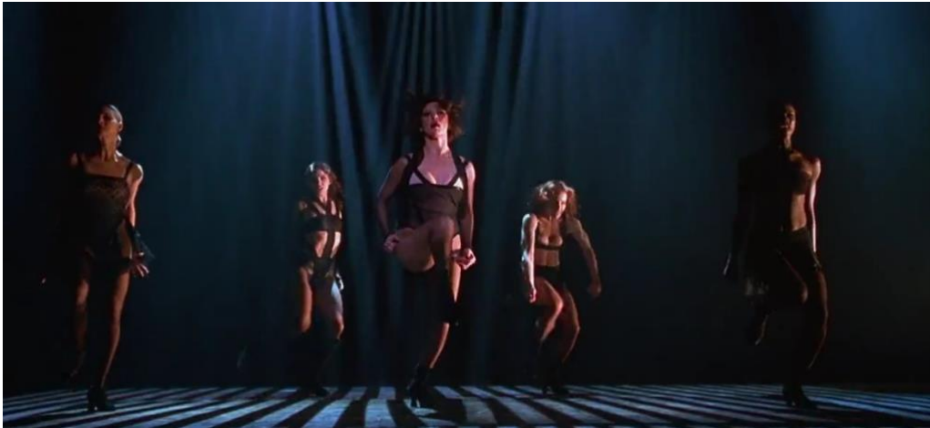
Figura 12. Cena de Chicago, o Filme

Fonte: Chicago, o filme. EUA: Miramax filmes, 2002.