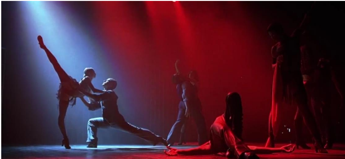
Figura 7. Cena de Chicago, o Filme