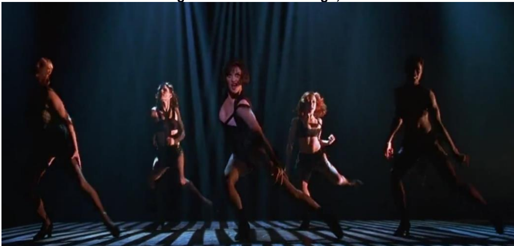
Figura 13. Cena de Chicago, o Filme

Fonte: Chicago, o filme. EUA: Miramax filmes, 2002.