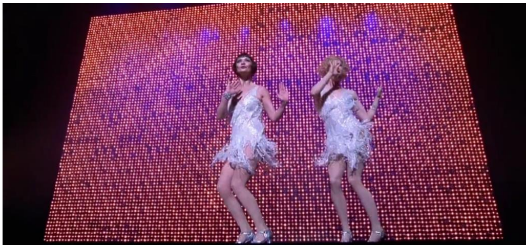
Figura 17. Cena de Chicago, o Filme