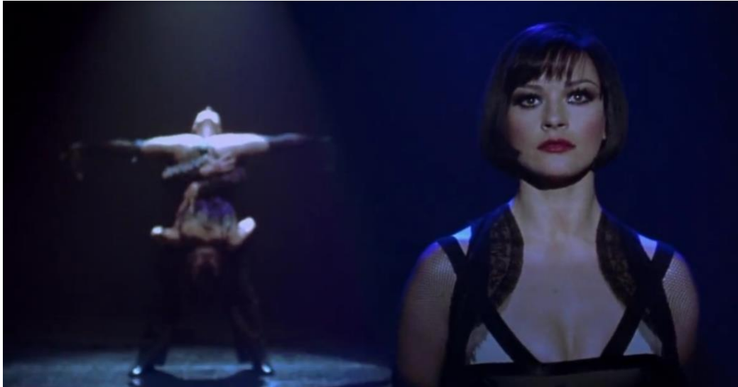
Figura 8. Cena de Chicago, o Filme