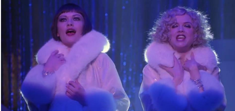
Figura 16. Cena de Chicago, o Filme

Fonte: Chicago, o filme. EUA: Miramax filmes, 2002.