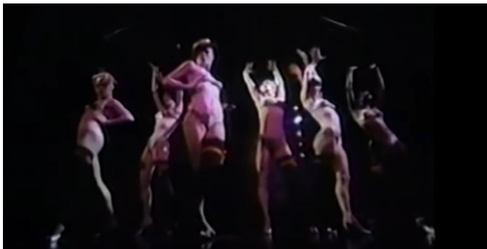
Figura 1. Cena de Steam Heat, o documentário