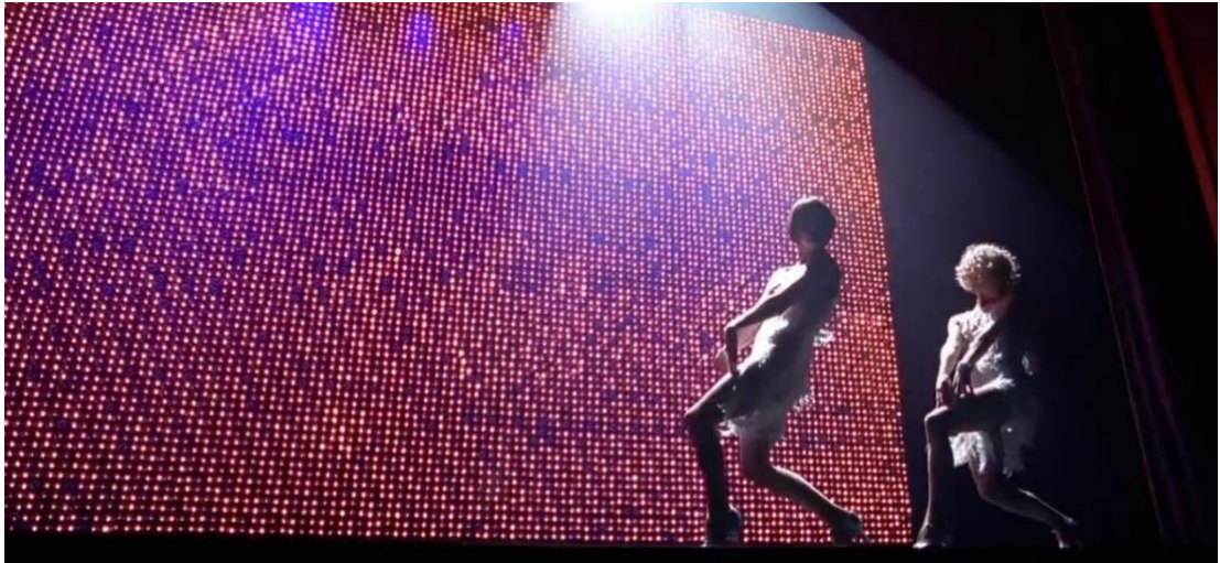
Figura 18. Cena de Chicago, o Filme