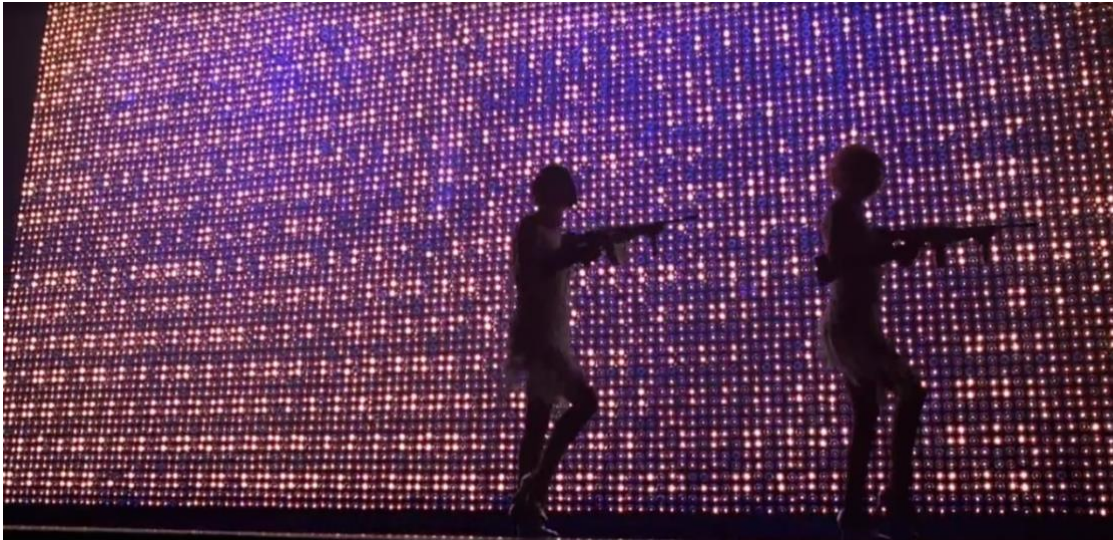
Figura 21. Cena de Chicago, o Filme