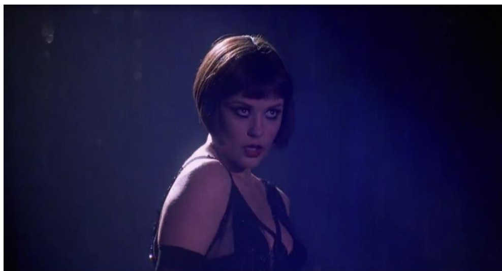
Figura 4. Cena de Chicago, o Filme

Fonte: Chicago, o filme. EUA: Miramax filmes, 2002.