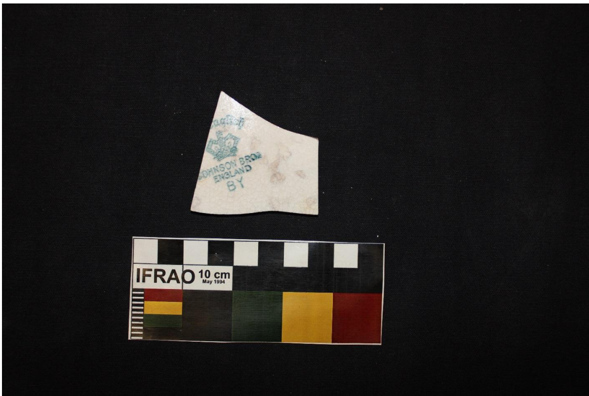
Figura 17 – LOUÇA JOHNSON BROTHERS. Autor: CARVALHO, Alberto, 2017

A chegada dessas louças em Manaus pode ter ocorrido por diversos meios: Importação e compra em algum estabelecimento de Manaus (Figura 18), através de troca, ou presente, o proprietário em viagem ao exterior pode ter adquirido, pode ter sido adquirida através de sorteios de jornais (Figura 19).