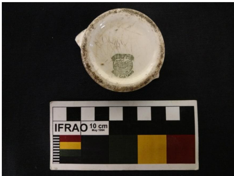
Figura 14 – LOUÇA IRFM – São Caetano (sem coroa). Autor: ROSAS, Tammy, 2015) (P.36)

Pelas marcas vistas no fundo da louça (na parte periférica), admite-se que ela seria de uso utilitário e na Figura 12 pode-se ver a base de uma xícara – de chá, de café – com parte da parede. Na Figura 13 é possível também notar as marcas de uso e um pequeno fragmento da alça.