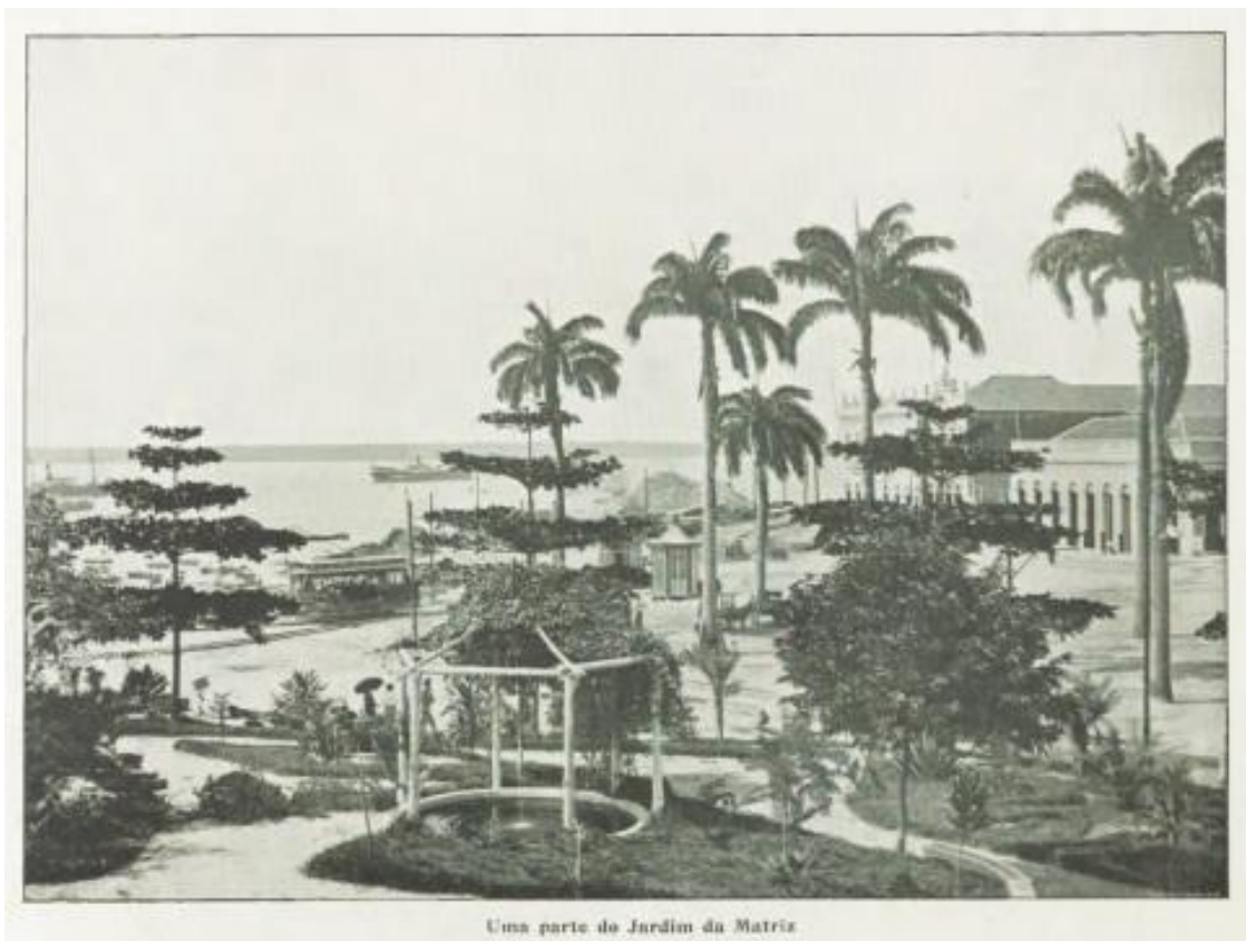
Uma parte do Jardim da Matriz Figura 1 – Jardins da Matriz, 1901-1902.