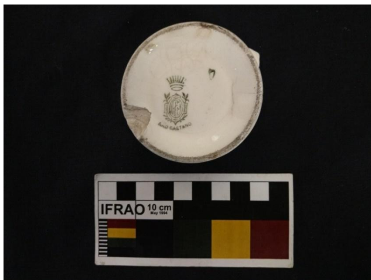
Figura 13 – LOUÇA IRFM – São Caetano (coroa de 8 pontas). Autor: ROSAS, Tammy, 2015.

Como mostrado nas imagens, a IRFM – São Caetano possui algumas diferenças sutis na logomarca. Uma coroa possui nove pontas e a outra possui oito pontas. As