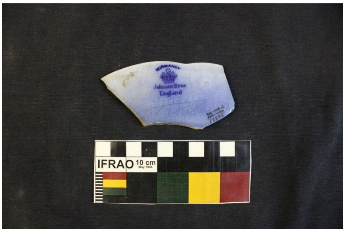
Figura 16 – LOUÇA JOHNSON BROTHERS. Autor: CARVALHO, Alberto, 2017

Segundo ZARUCCHI (2004) a empresa Johnson Brothers foi considerada a maior produtora e comerciante de louças durante 130 anos. Funcionou dos anos 1872 à 2002. Era uma empresa especializada em decorações para exportar principalmente para as Américas, onde eles estudavam as culturas e sociedades para reproduzir seus desenhos em porcelana.