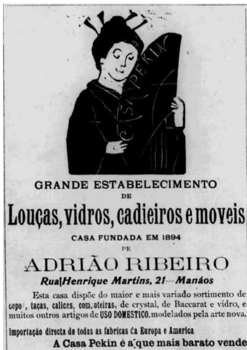
Figura 18- Recorte do jornal "O Bond", setembro de 1906, anúncio de loja de louças.

modo de fazer e seu modo de usar. Nos fala de práticas, o comércio intenso comprovado na época da borracha, o costume de frequentar os mais elitizados restaurantes e cafés, ou não, mesmo com uma renda baixa ser capaz de sentar à mesa de um restaurante com louças mais baratas, porém respeitadas. O ato de usar, decorar e se explicar socialmente através dos objetos, através das louças brancas, falam de relações interclasses esquecidas ou silenciadas (POLLACK, 1989) em detrimento dos grandes acontecimentos da Manaus da Belle Époque e também depois dela.