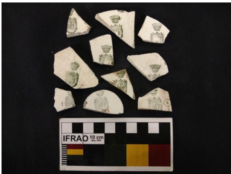
Figura 15 – LOUÇA IRFM – São Paulo. Autor: ROSAS, Tammy, 2015 (P.36)

A variedade e quantidade de louças branca Matarazzo resgatadas das escavações e salvamentos feitos na Igreja da Matriz em 2002, mostram grande potencial material, e que esse produto estava presente nos mais diversos aspectos da vida social do indivíduo da Manaus Antiga. Em primeiro lugar pelas marcas de uso, em segundo lugar pela quantidade, em terceiro lugar pelo contexto histórico em que se encaixam, valendo-se da grande vaidade do consumo e da memória coletiva que elas evocam ao serem lembradas.