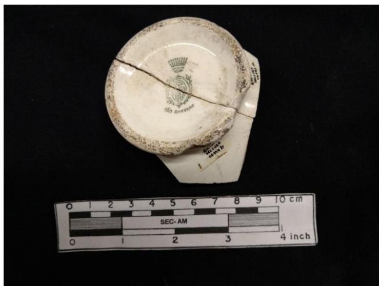
Figura 12 – LOUÇA IRFM – São Caetano (coroa de 9 pontas). Autor: ROSAS, Tammy, 2015

“Tem semelhança com a porcelana, é de composição diferente com a moagem do feldspato e do quartzo a pó não muito fino, pois as partículas ficam visíveis e desiguais em tamanho, dando a impressão de pó de pedra. No comércio para efeito de propaganda é chamada de meia porcelana.” (BRANCANTE, 1981, p. 707)