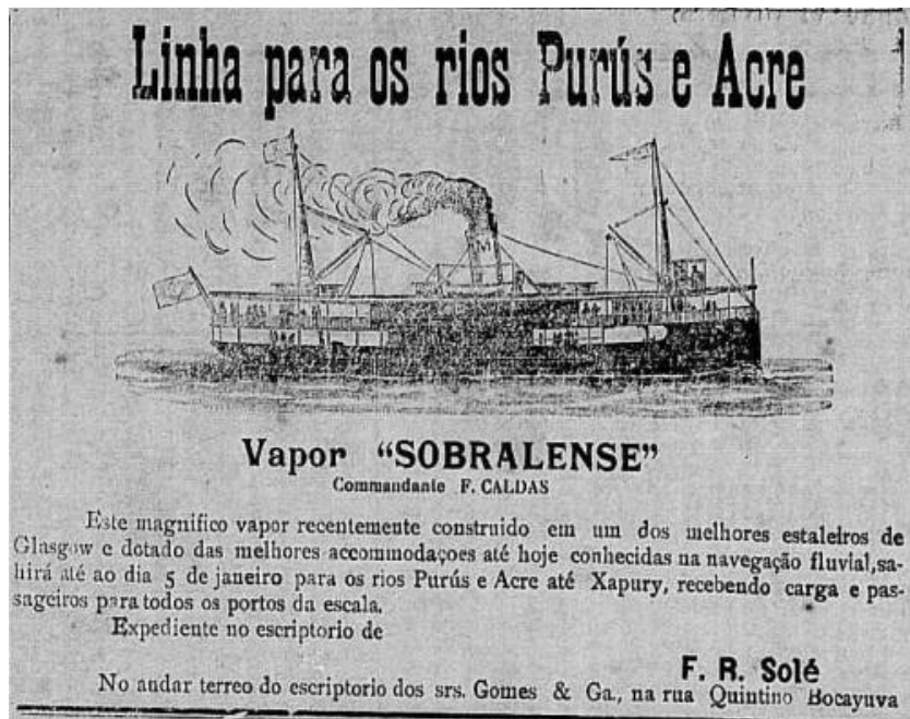
Figura 5 – Anúncio de viagem de navio à vapor, Correio do Norte, janeiro de 1912.

“Nas duas últimas décadas do século XIX, essas conexões intensificam-se, possibilitando a incorporação da Amazônia como parte crescente do mercado internacional. O volume de exportação da borracha começa a tomar destaque no conjunto das exportações da região. Ao dinamismo promovido pela economia gomífera a partir dos anos 1880, correspondeu a chegada de PESSOAS, CAPITAIS E MERCADORIAS, o que facultou para as ELITES da Amazônia uma situação de riqueza e prosperidade únicas.” (idem, 2000, p 17)