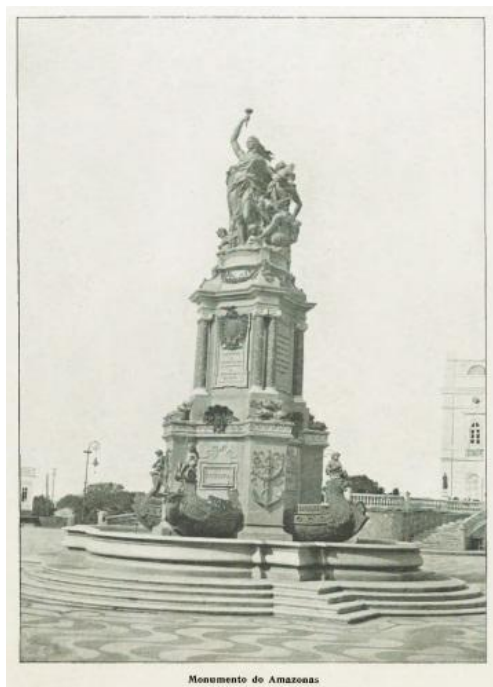
Figura 4 – Monumento de abertura dos portos, 1901-1902.