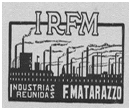
Figura 11 - Logomarca IRFM por volta de 1911.

É só em 1911 que as indústrias de Matarazzo carregam o nome “IRFM – Indústrias Reunidas Fábricas Matarazzo”. Em 1925 se tem registros das louças Matarazzo, em três fábricas distintas: Santa Catharina, São Caetano e São Paulo.