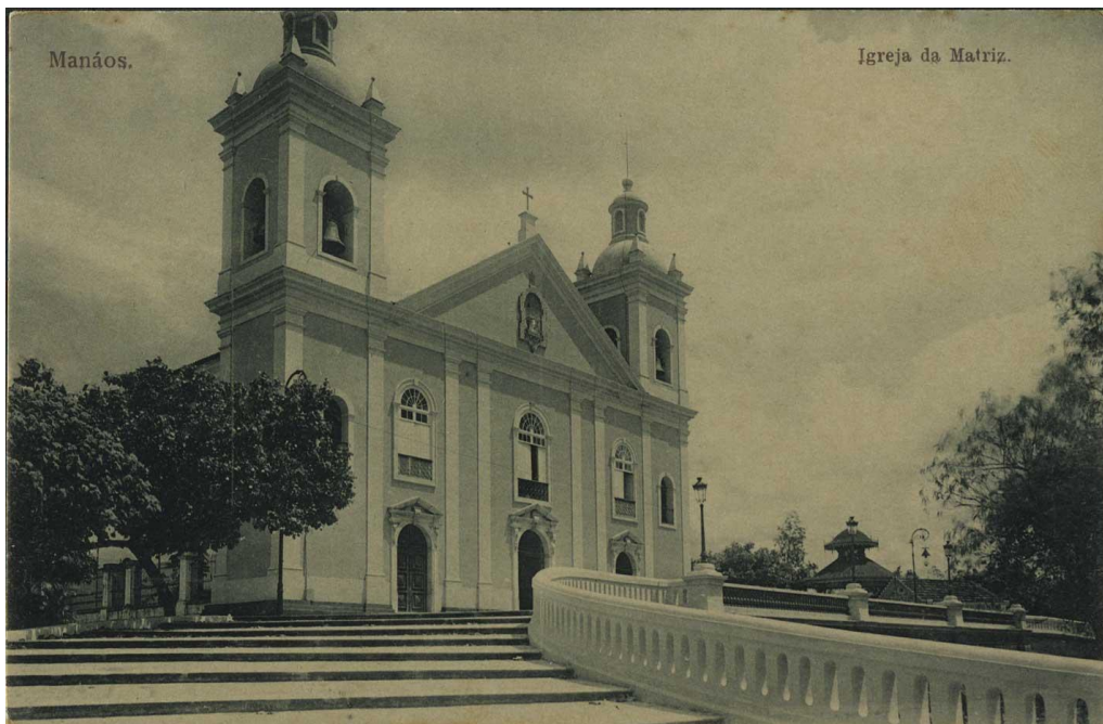
Figura 2 – Igreja da Matriz em 1909. Fonte: Biblioteca Nacional Digital. Acesso: 2016

No meio tempo, em 1848, Manaus é elevada à categoria de cidade, sendo chamada de “Cidade da Barra do Rio Negro” (MESQUITA, 2005). Vale ressaltar que nessa época a cidade ainda não foi tocada pelo “milagre econômico da borracha” e permanece com o status e estrutura de uma cidade rural.