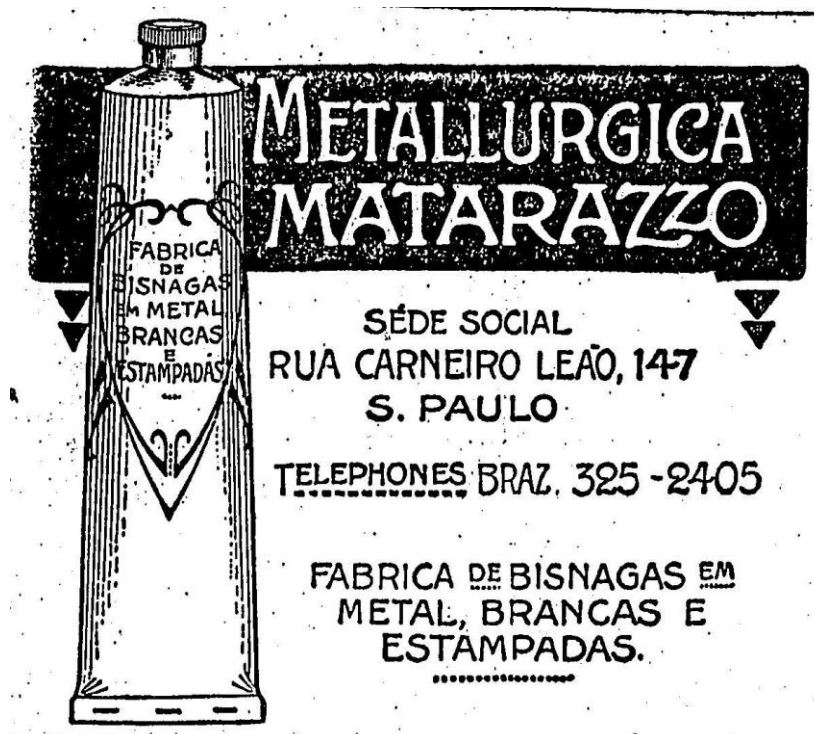
Figura 10 – Anúncio da Metalúrgica Matarazzo, sem data.

Em 1888, os negócios de Matarazzo estão faturando, então ele traz dois irmãos da Itália e cria a Matarazzo e Irmãos e em 1891 mais duas novas fábricas de banha, com nome de Companhias Matarazzo/SA. No mesmo ano é fundada a F. Matarazzo & Comp. Ltda., como uma casa de comissões e consignações. Mais tarde adere a importação. A partir dos anos de 1900 as fábricas Matarazzo passam por um rápido crescimento. É fundado o Moinho Matarazzo e o Banco Commerciale Italiano de São Paulo. Em 1902 surge a Metalúrgica Matarazzo. Em 1904 é fundada a Fábrica de Tecidos Mariângela (RODRIGUES e VILELA, 2013).