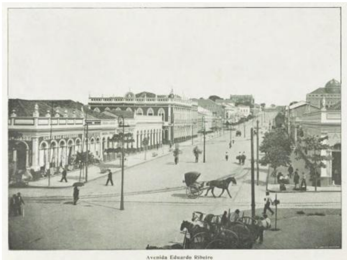
Figura 6 – Avenida Eduardo Ribeiro, 1901-1902.

As louças falam sobre relações sociais, sejam elas boas, ou ruins. Elas estavam presentes nos cafés da Eduardo Ribeiro, nos Armazinhos da Rua Municipal, nos Armazéns, nos comércios que vendiam da mais alta tecnologia, nos navios à vapor que chegavam e partiam, em casa, em um sem número de grupos domésticos e urbanos. Elas têm capacidade para falar de poder, de ambientação, o que se pode e o que não se pode fazer através da sua constituição física e simbólica.